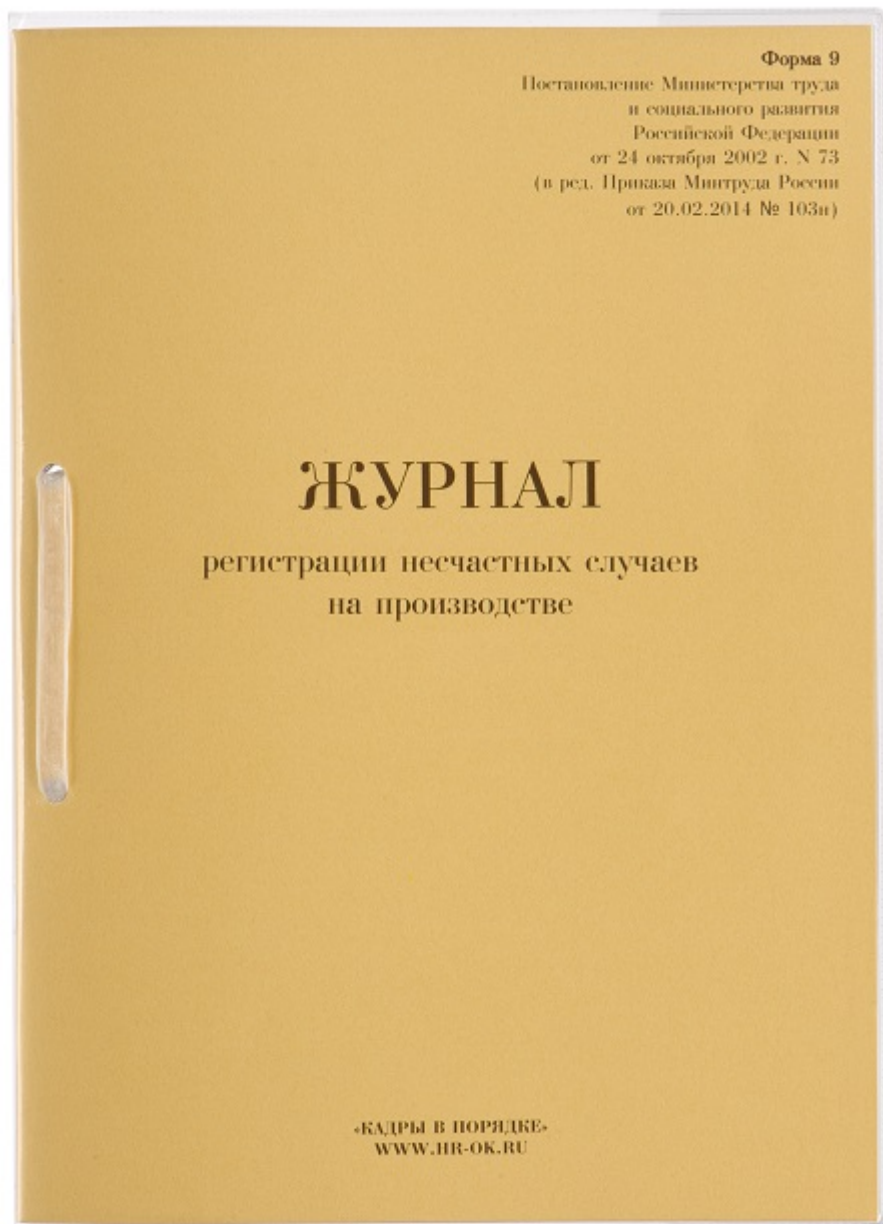
Вид основного раздела журнала